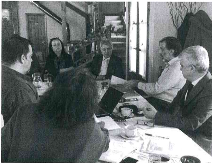
Από την συνάντηση στο Σουφλί μεταξύ των εταίρων του διασυνοριακού προγράμματος eTourist.

Κύριος στόχος του έργου είναι η ανάπτυξη και η δημιουργία καινοτόμων τεχνικών για την διατήρηση και προώθηση της πολιτιστικής και φυσικής κληρονομιάς των περιοχών του Χάσκοβου Βουλγαρίας και του Νομού Έβρου σε συνδυασμό με την προώθηση της παραδοσιακής γαστρονομίας, των τοπικών οίνων και τους τουριστικούς προορισμούς των δύο περιοχών.