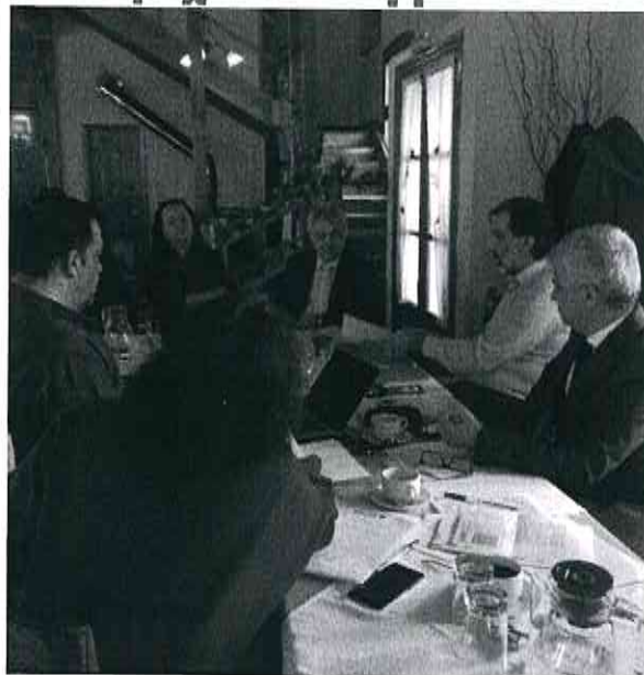
Συνέντευξη τύπου στο Σουφλί για το πρόγραμμα: Προώθηση και ανάπτυξη φυσικής και πολιτιστικής κληρονομιάς των Ελληνοβουλγαρικών συνόρων μέσω έξυπνων και ψηφιακών εργαλείων